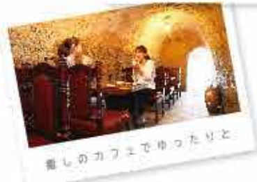
癒しのカフェでゆったりと