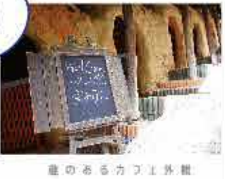
窯のあるカフェ外観