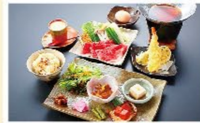
近江肉・牛すき焼御膳 ▶ 2,000円(税別)