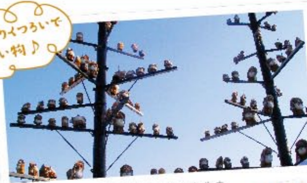
国道店のシンボルたぬ木