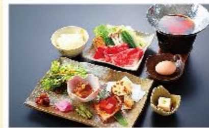
近江肉・牛すき焼御膳 ▶ 1,500円(税別)