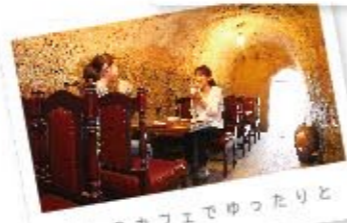
癒しのカフェでゆったりと