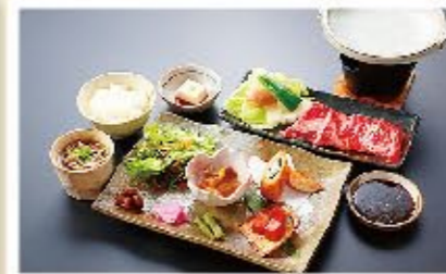
近江肉・牛陶板焼き御膳 ▶ 1,500円(税別)