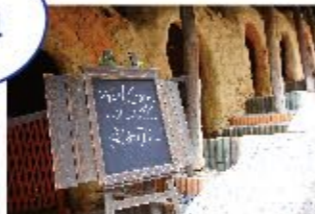
窯のあるカフェ外観