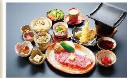
近江肉・牛瓦焼き御膳 ▶ 3,300円(税別)