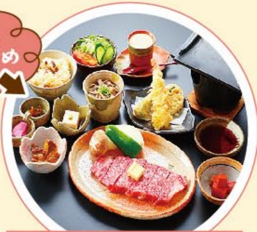
近江肉・牛瓦焼き御膳 ▶ 2,800円(税別)