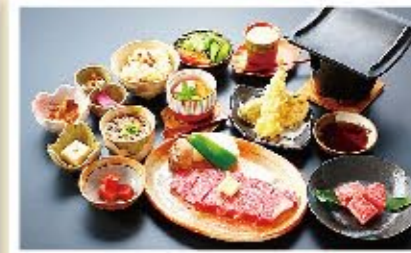
近江肉・牛瓦焼き御膳 ▶ 4,000円(税別)

※写真はイメージです。季節により多少異なる場合がございます。 ※メニューの指定は2日前までをお願い致します。 ※ご予算に応じてメニューの追加もできます。