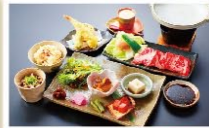
近江肉・牛陶板焼き御膳 ▶ 2,000円(税別)